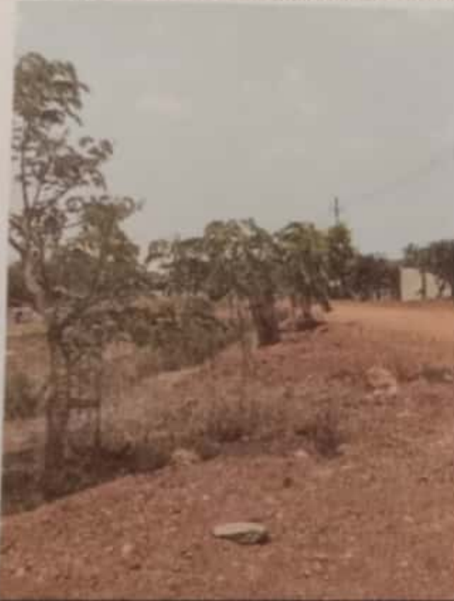
SH 57, Channakeshavanagar, Shikaripur, Karnataka 577427, India

Latitude Longitude 14.25399573° 75.36377378° Local 01:03:54 PM Altitude 537.07 meters GMT 07:33:54 AM Saturday, 04-10-2021