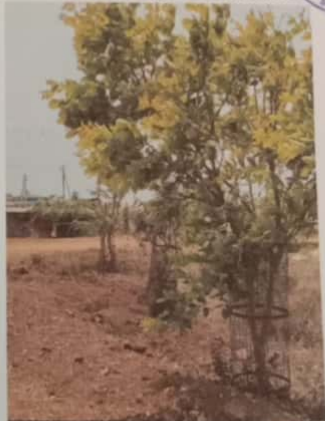
SH 57, Channakeshavanagar, Shikaripur, Karnataka 577427, India

Latitude Longitude 14.25399573° 75.36377378° Local 01:03:54 PM Altitude 537.07 meters GMT 07:33:54 AM Saturday, 04-10-2021