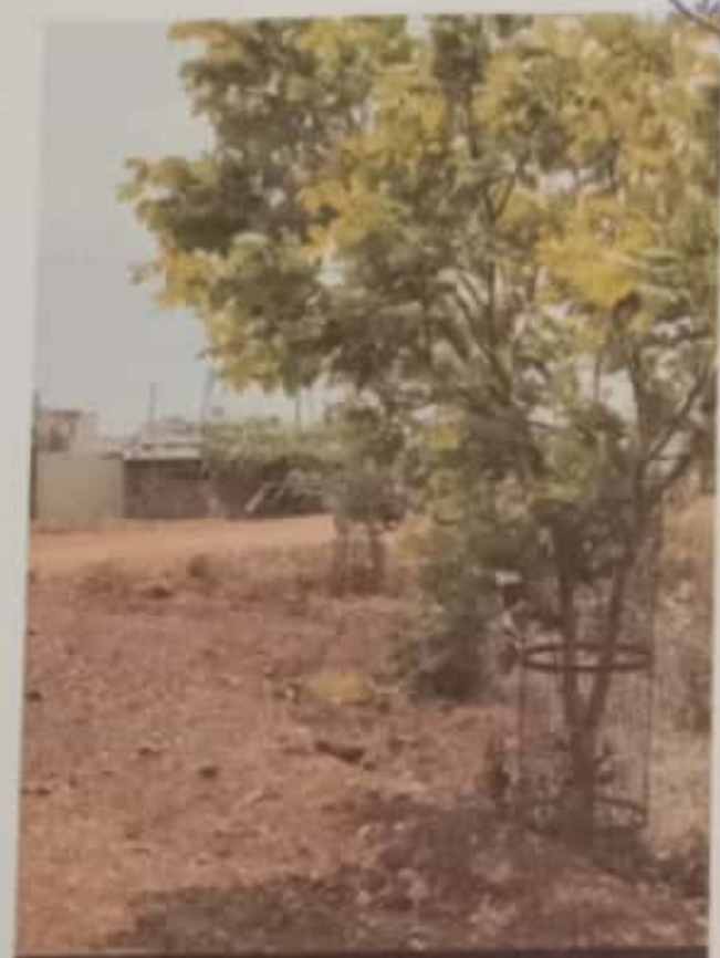
SH 57, Channakeshavanagar, Shikaripur, Karnataka 577427, India