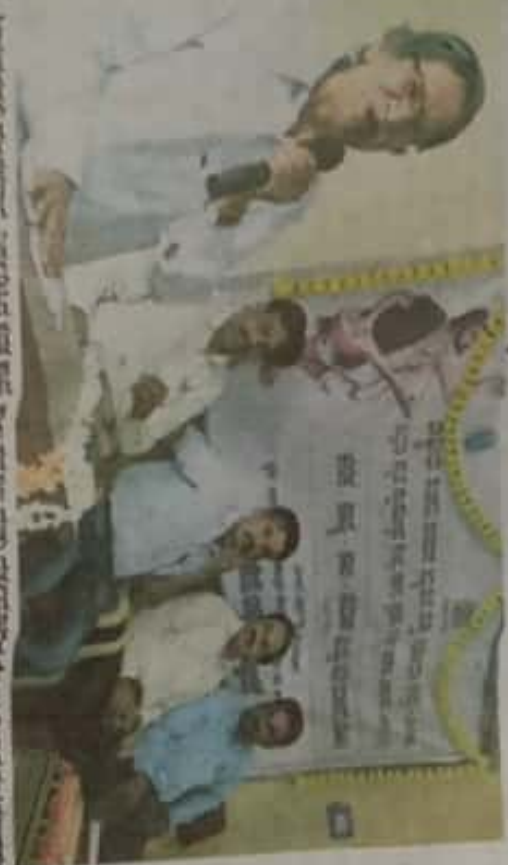
ಕನಡ ಶ್ರೀಮಂತಗೊಳಿಸಿದ ಕನಕದಾಸ

ಕನಡ ಶ್ರೀಮಂತಗೊಳಿಸಿದ ಕನಕದಾಸ ಕನಡ ಶ್ರೀಮಂತಗೊಳಿಸಿದ ಕನಕದಾಸ ಕನಡ ಶ್ರೀಮಂತಗೊಳಿಸಿದ ಕನಕದಾಸ