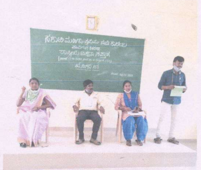
Bellary Rd, Banashankari, Pavagada, Karnataka 572202, India